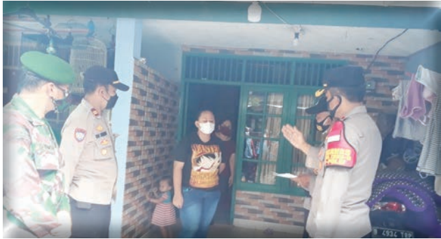
JAKARTA, (FN) - Sejumlah warga terkonfirmasi positif Covid-19 di wilayah Kem-